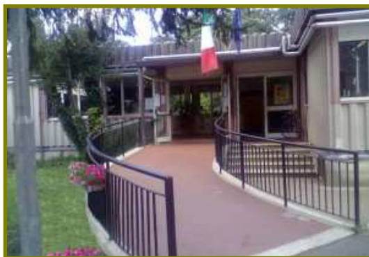
Sede scuola secondaria I° grado “Nocetta”

Date, Orari e Modalità dei nostri Open Day Sabato 15 dicembre 2018 dalle 10:00 alle 12:00, incontro con i docenti responsabili dell'accoglienza nuovi alunni. Mercoledì 9 gennaio 2019: incontro informativo del Dirigente Scolastico con i genitori dalle 17:30 alle 19:00. Sabato 12 gennaio 2019 dalle 10:00 alle 12:00, incontro con i docenti responsabili dell'accoglienza nuovi alunni.